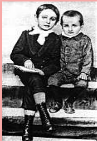
Лесь Курбас у дитинстві з братом Нестором. Репродукція.

Хлопець навчався у Тернопільській гімназії, у Віденському та Львівському університетах. Тому цілком природно, що Лесь увібрав у себе все те, що могла дати йому європейська культура. Вже тоді Курбас мріяв працювати на Наддніпрянській Україні, де існував демократичний театр Садовського (Київ) і де поруч була висока театральна культура.