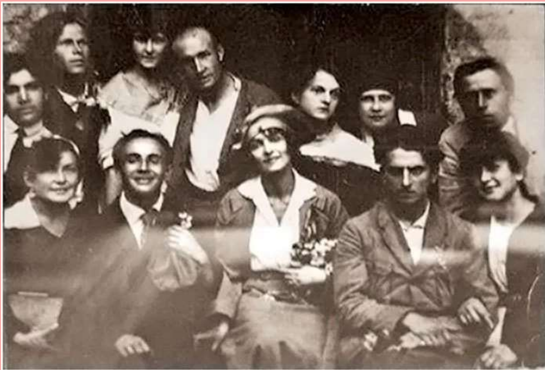
Весілля Леся Курбаса та Валентини Чистякової (Київ, 1919 р.)