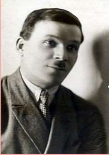
Микола Куліш, 1929 рік

Лесь Курбас і «березільці» знайшли свого драматурга, п'єси якого були співзвучні їхнім естетичним прагненням. Таким драматургом став Микола Куліш. Першою його п'єсою, що побачила світло рампи на сцені театру «Березіль», стала «Комуна у степах» (Київ). Творча співпраця тривала і в Харкові.