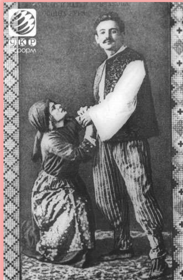
Лесь Курбас і Катерина Рубчакова у виставі "Осінь буря" (1914 рік).