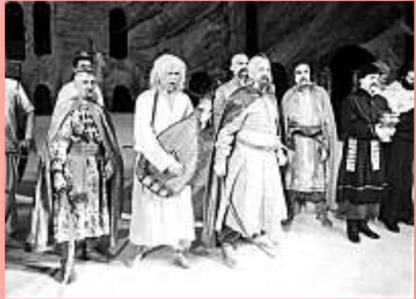
На сцені актори Волинського обласного драматичного театру у виставі "Гайдамаки" за однойменним твором Тараса Шевченка в інсценуванні Леся Курбаса. Фото 1989 року. Із фондів УКРІНФОРМу.