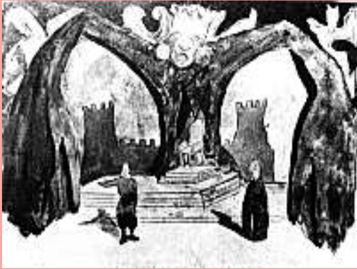
Ескіз оформлення до вистави "Сонце руїни". Художник - Лесь Курбас (1920 рік). Репродукція.