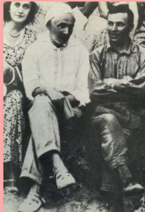
Акторка Софія Федорцева, режисер Лесь Курбас і письменник Микола Куліш