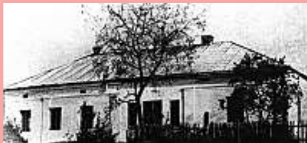
Будинок, у якому народився Лесь Курбас. Місто Самбір на Львівщині. Фото 1987 року.