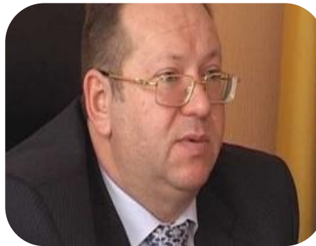
Ровинський Ю.О. Начальник теруправління Нацкомісії з цінних паперів та фондового ринку