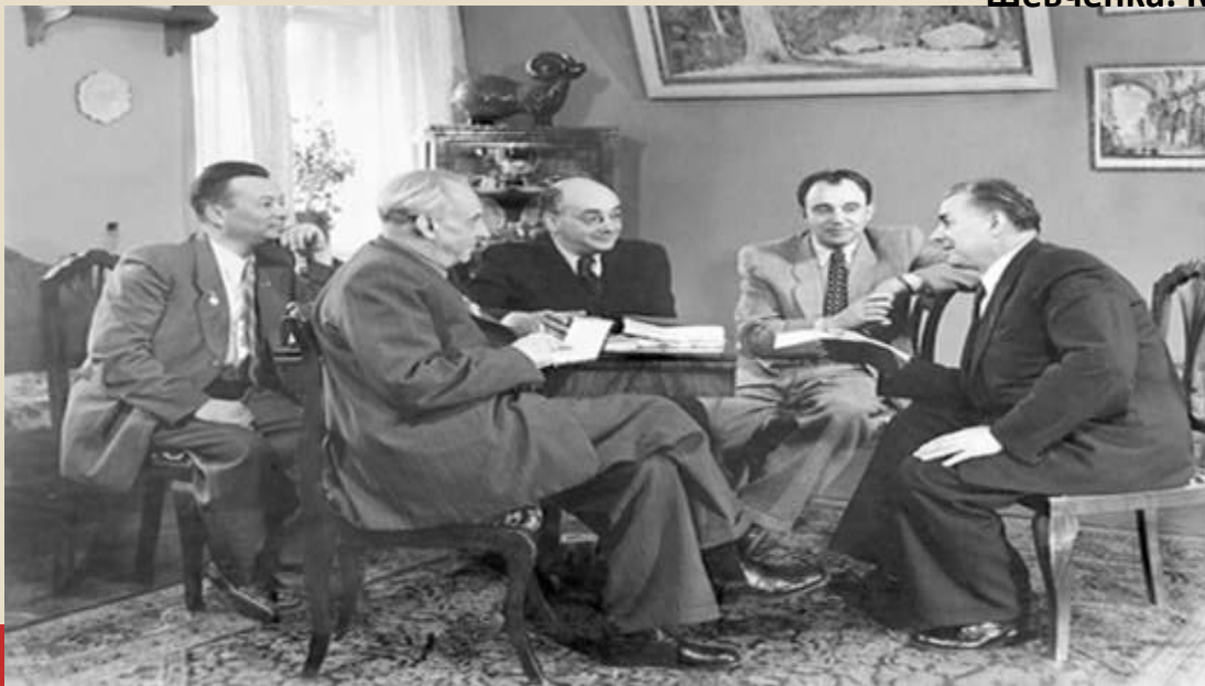
Павло Тичина серед українських письменників: Андрій Малишко, Максим Рильський, Микола Бажан, Олександр Корнійчук, Павло Тичина, 1952 р.