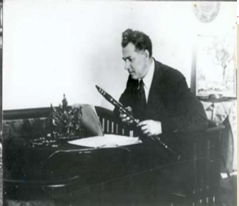
Павло Тичина з кларнетом, 1940-ві роки