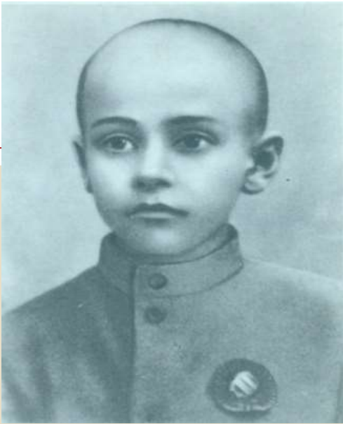
Павло Тичина - учень бурси, 1901 рік