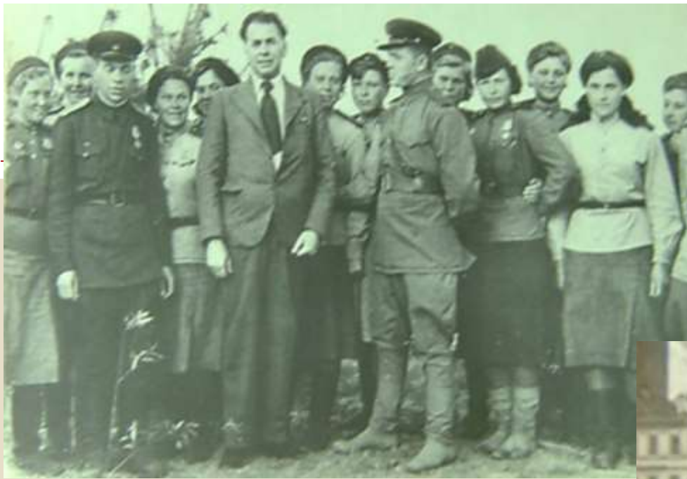
Павло Тичина серед зенітниць, літо 1944 р.