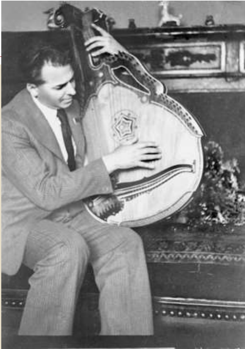
Павло Тичина з бандурою, 4 червня 1946 р.