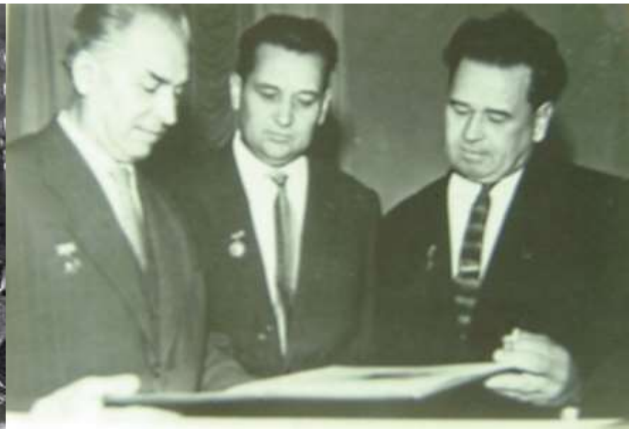
Павло Тичина, Олесь Гончар, Платон Майборода - перші лауреати Національної премії ім. Тараса Шевченка. Київ, 7 червня 1962 р.