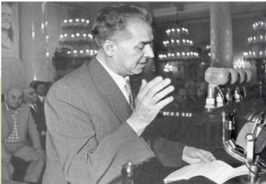
Павло Тичина читає свої вірші на Декаді української літератури, 1951 рік.