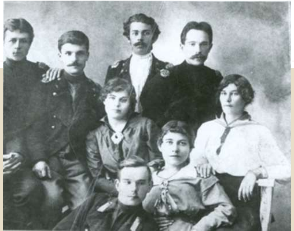
Павло Тичина серед друзів, 1913 - 1914 рр.