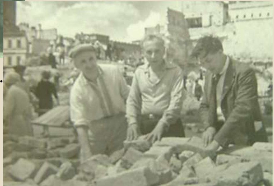
Павло Тичина, Максим Рильський, Юрій Яновський на відбудові Хрещатика, 1944 р.