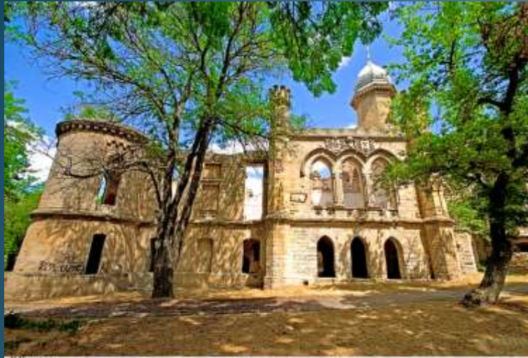
Н.Наситен „Дворец Курісов, южная сторона“.